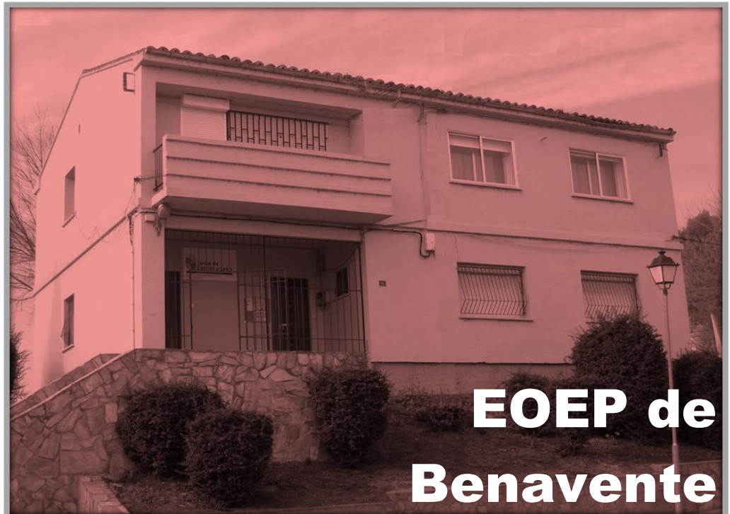
EOEP de Benavente